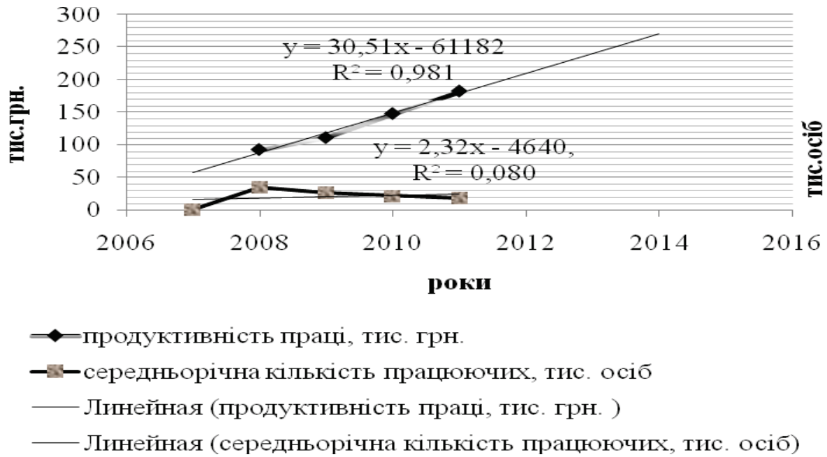
Рис 1 . Середньорічна чисельність працівників та продуктивність праці у сільськогосподарських підприємствах Житомирської області