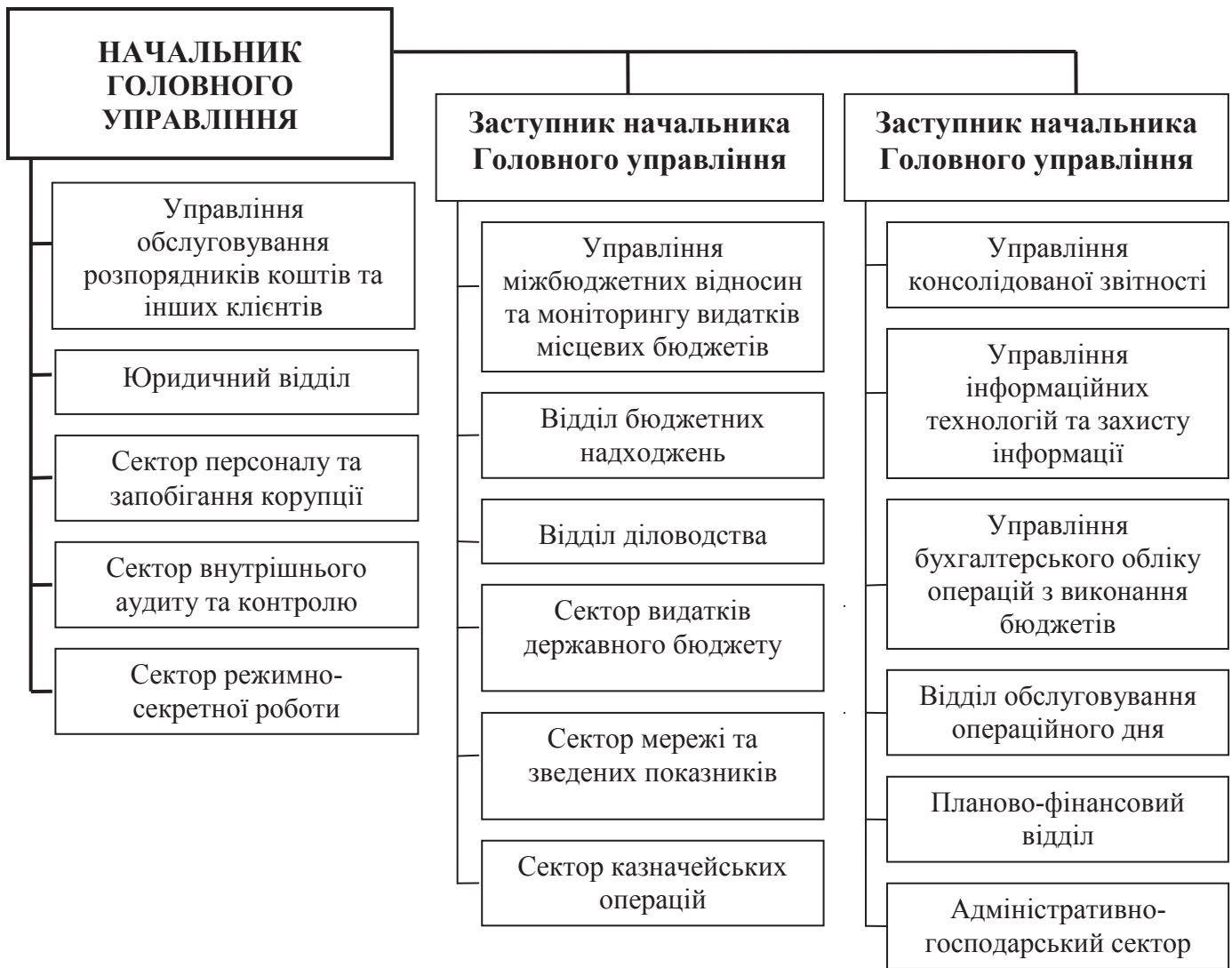
Рис. 3. Типова організаційна структура обласних управлінь Державної казначейської служби України.

- здійснення контролю за складанням і поданням фінансової та бюджетної звітності, відповідності кошторисів розпорядників бюджетних коштів показникам розпису бюджету, а також платежів аграрних підприємств, організацій та інших одержувачів узятим бюджетним зобов'язанням ;