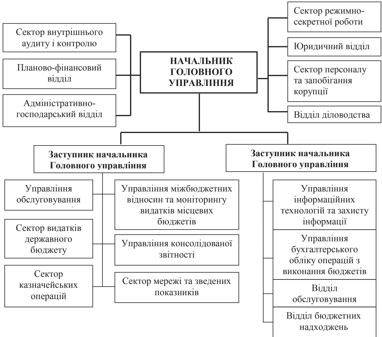
Рис. 2. Організаційна структура управління Державної казначейської служби України в Автономній Республіці Крим

- ведення обліку бюджетних асигнувань, доведення до аграрних підприємств, організацій та інших одержувачів бюджетних коштів витягу із розпису державного бюджету та змін до нього;