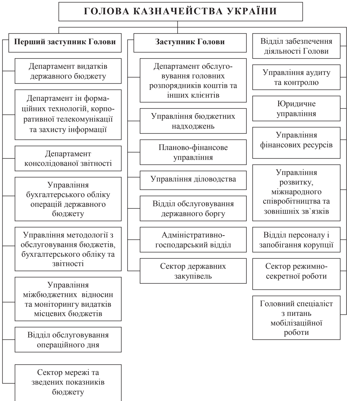
Рис. 1. Організаційна структура Державної казначейської служби України

Контрольна функція структурних підрозділів Державної казначейської служби України, які обслуговують аграрні підприємства та організації полягає