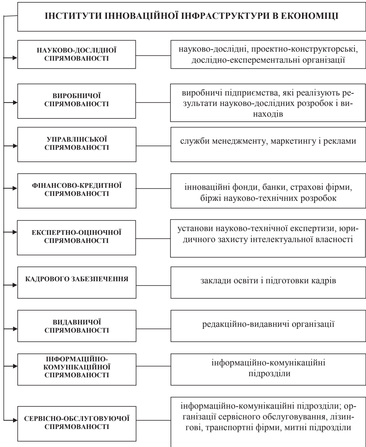
Рис. 1. Об'єкти інфраструктурного забезпечення формування інтелектуального капіталу і розвитку-поширення інновацій в національній економіці*

*Сформовано на основі нормативних документів.