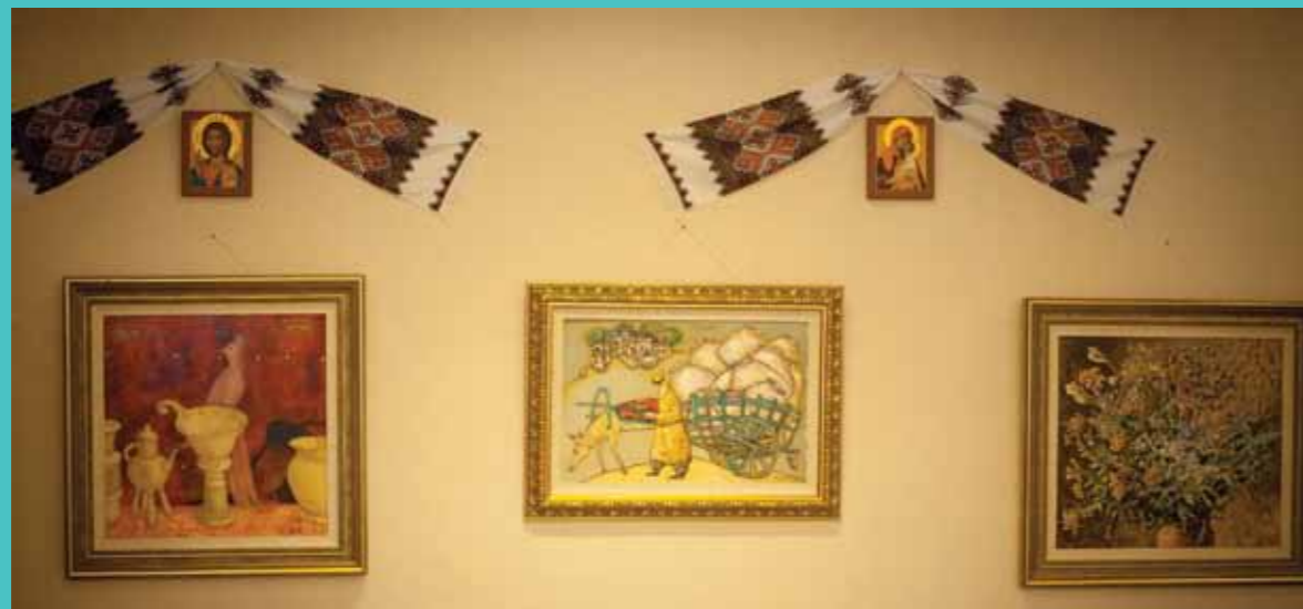
Україна і Китай: культурні кордони подолано!