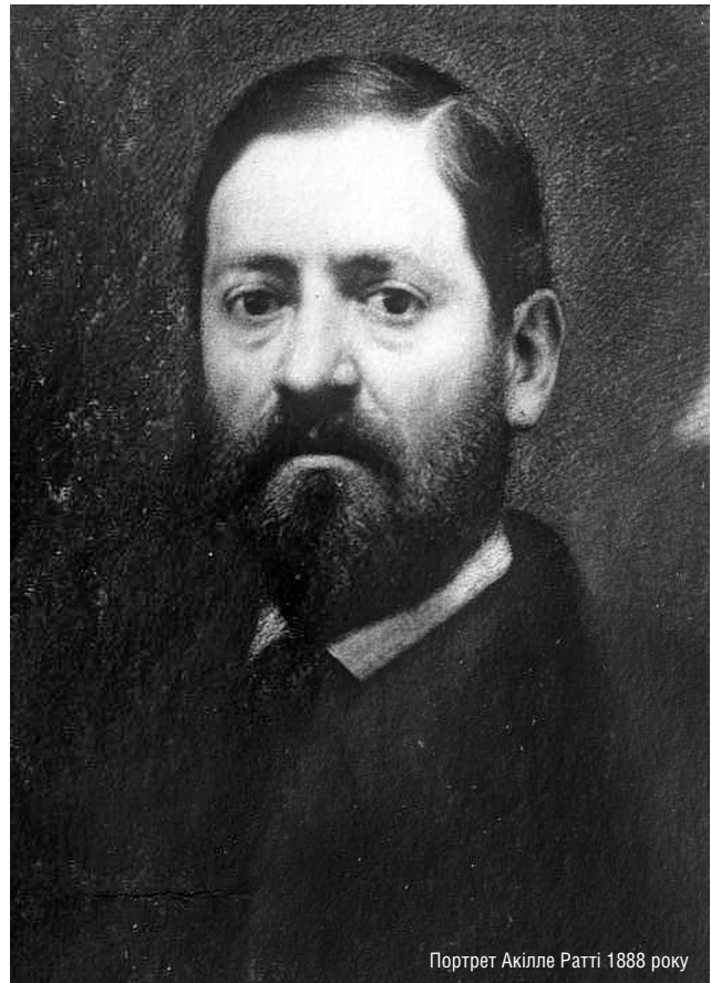
Портрет Акілле Патті 1888 року

Завдяки Токаржевському 23 листопада 1921 р. були підписані протоколи про наміри союзних міждержавних угод з Грузією, 28 листопада – з Азербайджаном. Союзники мали надавати «взаємну допомогу дипломатичним і політичним шляхом у справі захисту політичної незалежності», об'єднати зусилля «у спільній боротьбі проти РСФРР з метою звільнення від окупації», а у разі втручання у боротьбу на боці Москви третьою стороною УНР, Грузія, Азербайджан і Північний Кавказ мали «діяти проти неї спільно». Я. Токаржевський-Карашевич 12 лютого 1922 р. переслав керуючому посольством справ у Царгороді копію інструкції голови дипломатичної місії в Парижі у справі організації Чорноморського союзу, а також копії апробованих урядом УНР проектів трьох союзних договорів, які були укладені 26 липня в Царгороді між представником УНР, Грузії, Азербайджану й Північного Кавказу. Він також курував співпрацю в прометейському русі та в Антибільшовицькому блоці народів. С. Петлюра подякував йому: «...одному з тих наших державних діячів, що давно вже змагались надати зносинам нашої держави з державами Кавказу сталий і дружний контакт. Ще на посаді посла в Царгороді Ви започаткували переговори з представниками Кавказьких республік. В міру сил своїх, уже на посаді керуючого Міністерством Закордонних справ, Ви підтримували