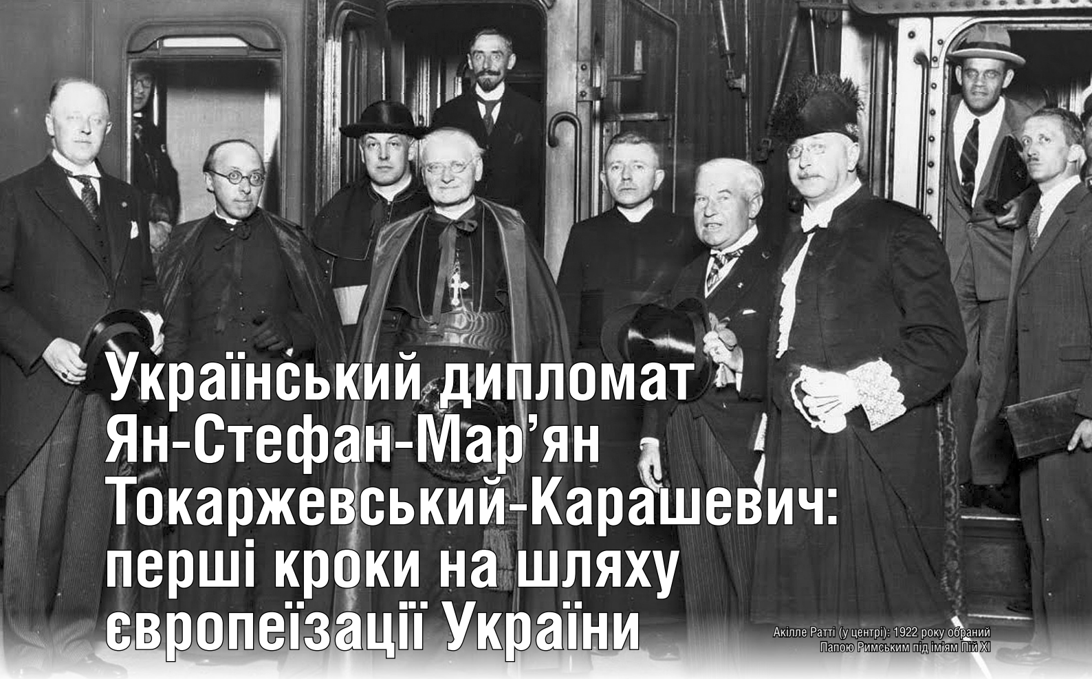
Акілле Ратті (у центрі): 1922 року обраний Папою Римським під іменям Пій XI