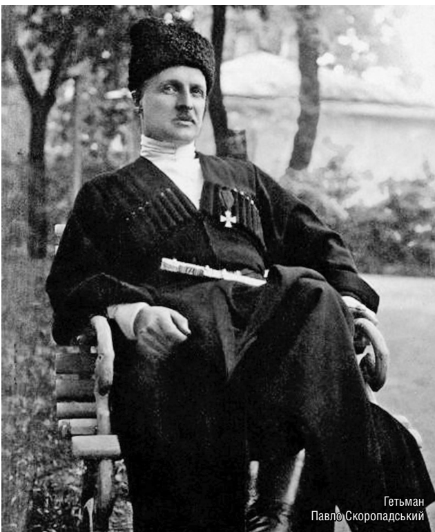
Гетьман Павло Скоропадський

8 серпня 1923 р. Я. Токаржевський видав інструктивний лист до всіх підлеглих послів з пропозицією розвінчувати незаконну діяльність більшовицького уряду в Україні, в якому закликав країни Європи не входити в контакти з СРСР. За його пропозицією послі мали сформулювати до відповідного уряду, при якому вони були акредитовані, ноту протесту, а назворот надсилати копії цих нот. Дипломат вказував: «Українська нація, свідомо своєї окремішності, інтересів і сили, ніколи не погодиться на ті всі спроби приборкати її остаточно під російське ярмо. І прийде той час, коли вже ані терор окупантських військ, ані штучні постанови посланих з Москви управителів не зможуть втримати Україну в большевицьких руках» [4].